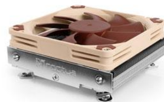
オプション搭載可能な CPU クーラー Noctua 製「NH-L9I-17XX」

Radiant SPX3300B860i は、ASRock 製のベアボーン「DeskMini B860」をベースに、ケース側面に SilverStone 製防塵フィルタ「SST-FF141」を標準装備した、Intel® Core™ Ultra プロセッサ搭載の超コンパクトでハイパフォーマンスなモデルです。本体サイズ幅 80×奥行き 155×高さ 155mm、容量わずか 1.92L の筐体に、16GB(8GB×2 枚組)の DDR5 メモリ、1TB の Crucial 製 SSD、電源にはノートパソコンのような外付けの 120W AC アダプターを採用しています。ケース背面には Thunderbolt™ 4、DisplayPort(×2)、HDMI の出力ポートを備えクアッドディスプレイ出力に対応しています。