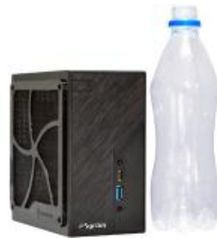
500ml のペットボトルとのサイズ比較