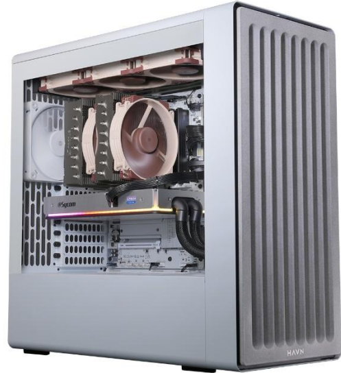
G-Master Spear BF360 Limited Edition