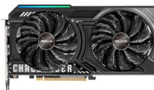
ビデオカードは ASRock 製 「AMD Radeon™ RX 9060 Challenger 8GB」を 標準装備

G-Master Velox シリーズは、CPU、マザーボード、メモリ、ビデオカードなどの各パーツにおける複雑なカスタマイズをしなくても、標準構成のままで十分なパフォーマンスを発揮するよう設計されたゲーミングモデルです。OS やアプリの起動も高速で、人気のゲームタイトルにおいても最高画質で快適に遊べる実力を備えます。「G-Master Velox II AMD Edition」は、CPU に 8 コアを搭載した AMD Ryzen™ 7 5700X プロセッサを搭載し、ビデオカードには AMD RDNA™ 4 アーキテクチャを採用したグラフィックスカード「AMD Radeon™ RX 9060」搭載 ASRock 製の「AMD Radeon™ RX 9060 Challenger 8GB」を装備、CPU クーラーには Noctua 社製の「NH-U12S redux」装備したコストパフォーマンスの高い製品です。