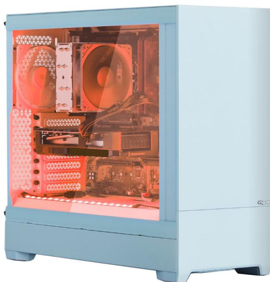
G-Master Velox II AMD Edition ※内部構成はオプション