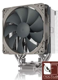
CPU クーラーは 世界屈指の空冷最強メーカー Noctua 社製の「NH-U12S redux」 を標準装備