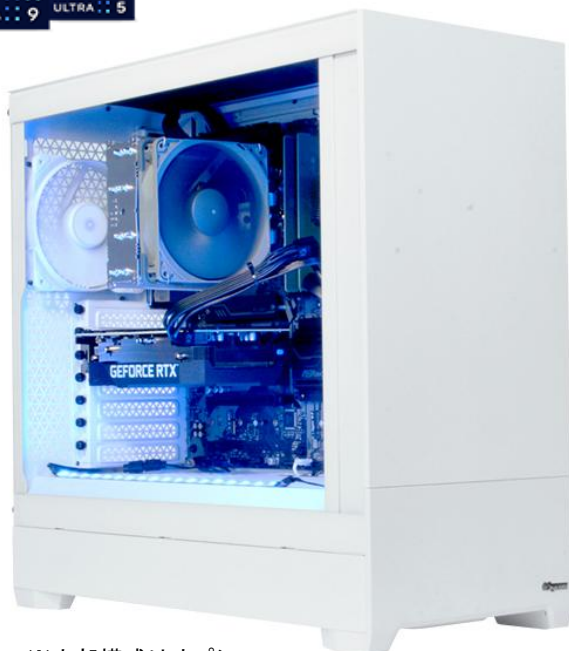
※内部構成はオプション