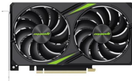
ビデオカードは Manli 製「Nebula GeForce RTX 5060 8GB GDDR7」を標準装備