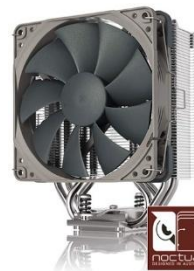
CPUクーラーは Noctua 製の 「NH-U12S redux」 を標準装備

G-Master Velox シリーズは、CPU、マザーボード、メモリ、ビデオカードなどの各パーツにおける複雑なカスタマイズをしなくても、標準構成のままで十分なパフォーマンスを発揮するよう設計されたゲーミングモデルです。OS やアプリの起動も高速で、人気のゲームタイトルにおいても最高画質で快適に遊べる実力を備えます。