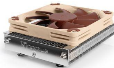
オプション搭載可能な CPU クーラー Noctua 製「NH-L9a-AM5」

標準構成での価格は、AMD Ryzen™ 5 8600G 搭載モデルで 124,600 円(税込)より。OS には標準で Windows 11 Home (64bit) がインストールされています。納期については製品サイト上にリアルタイムで表示される納期での納品になります。